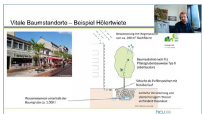
Baumstandorte in Hölertwiete in Hamburg.

In der anschließenden Diskussion betonen die Referent*innen die Notwendigkeit von deutlich mehr Pilotprojekten wie der i.WET-Allee, die auch schneller in die Breite getragen werden müssten. So könne ein Anstoß für regelwerksgebende Institutionen geboten werden, um aktuell hemmende Regelungen an die Anforderungen von blau-grüner Infrastrukturen anzupassen. Dazu müssten die Akteure das Silodenken in der Infrastrukturplanung hinter sich lassen und die Schnittstellen zwischen Gebäuden und der außenliegenden Infrastruktur stärker in den Blick nehmen.