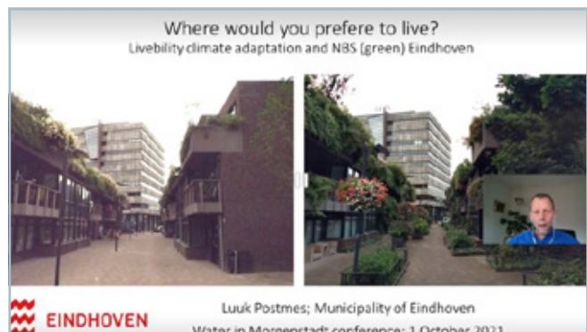
Naturbasierte Lösungen in Eindhoven, Niederlande.

In der abschließenden Diskussion wird die Anpassung der naturbasierten Lösungen an den damit einhergehenden steigenden Wasserbedarf in der Stadt thematisiert. Eindhoven hatte durch hoch anstehendes Grundwasser lange Zeit keine Bewässerungsprobleme. Die Sommer 2019 und 2020 zeigten jedoch, dass auch hier neue Lösungen in der Zukunft erforderlich werden. Eindhoven setzt dafür auf die Auswahl von stärker trocken- und hitzeresistenten Pflanzen, da von einer Bewässerung mit Trinkwasser abgesehen werden soll.