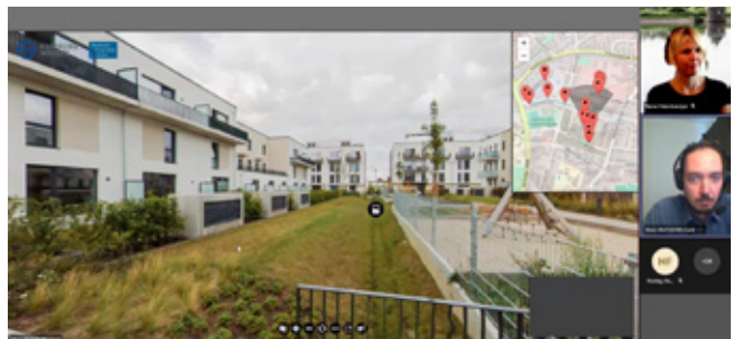
Stadtquartier »Jenfelder Au« in Hamburg.

Die komplexere Bewirtschaftung von Schwarzwasser geschieht mit einem Schwarzwasserunterdrucknetz, welches das Schwarzwasser aus den flächendeckend eingebauten Unterdrucktoiletten in Unterdruckleitungen in den an das Quartier grenzenden Betriebshof von HAMBURG WASSER transportiert. In dem dortigen Schwarzwasserpumpwerk werden Co-Substrate (aus der Lebensmittelindustrie) für eine erhöhte Energiegewinnung zunächst zerkleinert und dann dem Schwarzwasser zugesetzt. Die Teilnehmenden erfahren während der digitalen Exkursion anschaulich, wie ein ressourceneffizientes Abwassermanagement durch die Stoffstromtrennung in Schwarz- und auch Grauwasser in dem Hamburger Stadtquartier implementiert und betrieben wird.