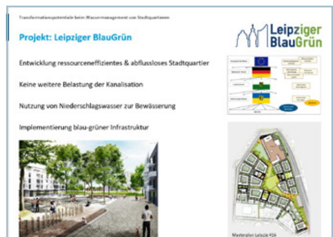
Projekt Leipziger BlauGrün.

es ist, Gelegenheitsfenster insbesondere bei Neubau und Sanierung zu nutzen sowie ein größeres Bewusstsein und eine stärkere Identifikation mit der Thematik in der Bevölkerung herzustellen. In der Diskussion wird die Entsorgung und Wiederverwertung des Abwassers im Stadtquartier aufgegriffen, was auch in Zukunft eine große Rolle spielen wird. Ebenfalls wird erneut auf die momentan drängendste Herausforderung der Veränderung des lokalen Wetters aufgrund des Klimawandels eingegangen. Der Vortrag veranschaulicht dabei eindrücklich die Relevanz des engen Zusammenspiels von Forschung und Administration.