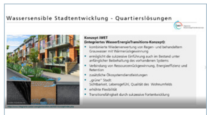
Das Konzept iWet.

mittels blau-grüner Infrastrukturen auf die Veränderungen im Zuge des Klimawandels zu reagieren. Essenziell seien dabei die innovative Kombination aus dezentralen und zentralen, aber auch konventionellen und innovativen Elementen in der Aufbereitung, Speicherung und Nutzung von Wasser. Diese Kombination und Einführung neuer Komponenten erfordere die frühzeitige Einbindung aller relevanten Akteure und einen konsequenten Veränderungswillen in den lokalen Behörden und Kommunen.